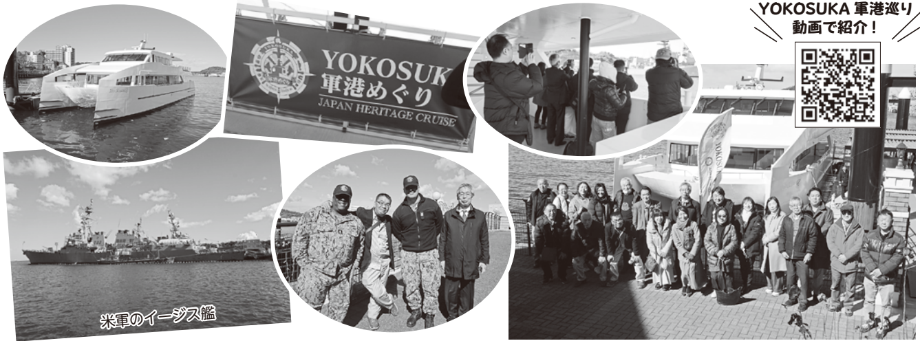
3/4~5 八千代ブロック管外研修会(一泊二日)