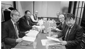
2/28 第3回正副会長・総務委員長会議