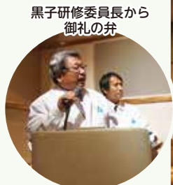
黒子研修委員長から 御礼の弁