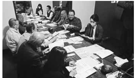
2/26 千葉北ブロック 第2回 役員会