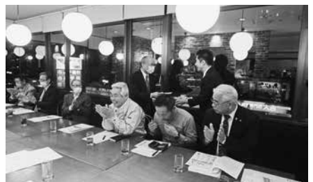
3/12 八千代ブロック 第3回 役員会