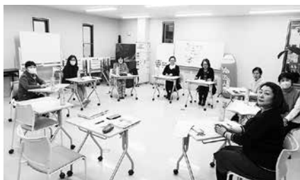
2/4 女性部会 第5回役員会