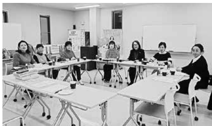
3/4 女性部会 第6回役員会