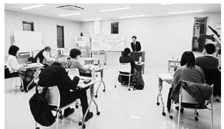
2/7 税法研究部会 第6回研修会