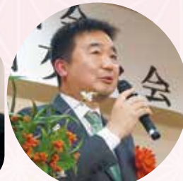
習志野市 宮本 泰介 市長 祝辞 (業務調整し駆けつけてくださいました)