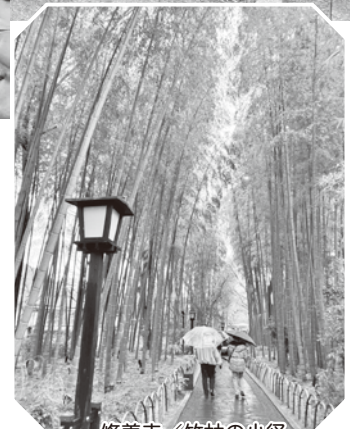
修善寺/竹林の小径