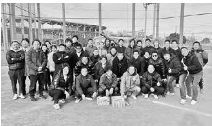
2/21 青年部会 三会合同モルック大会