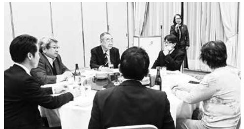
2/20 千葉西ブロック 第2回 役員会