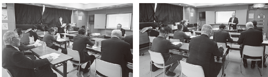
テーマ「事業承継を4つの目で見える」