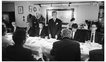
1/24 習志野ブロック 第2回 役員会