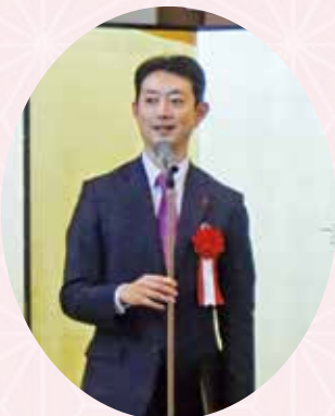
熊谷 俊人 千葉県知事からの祝辞