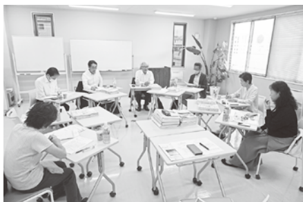
5/15 (木) 第1回広報委員会