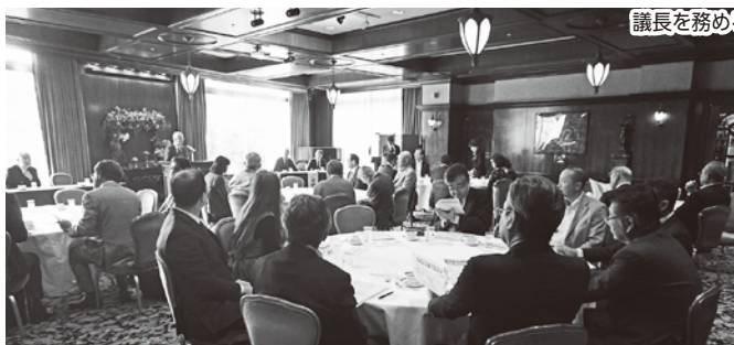
理事33名、監事2名が出席