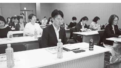
6/17 (火) 女性部会教養講座