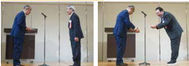
組織功勞ブロック表彰/金賞 習志野ブロック 同 銀賞 千葉北ブロック