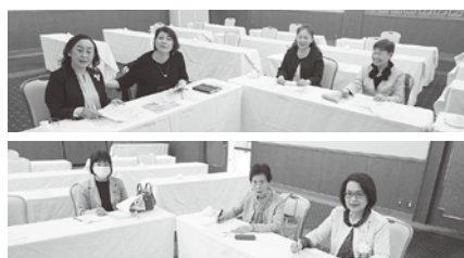
4/8 (火) 女性部会第1回役員会