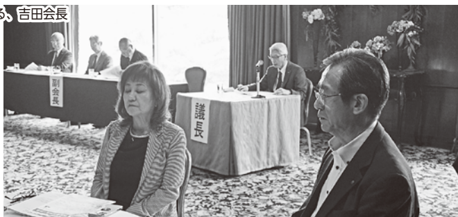
松内、須田監事(手前)と業務執行理事(議長左)