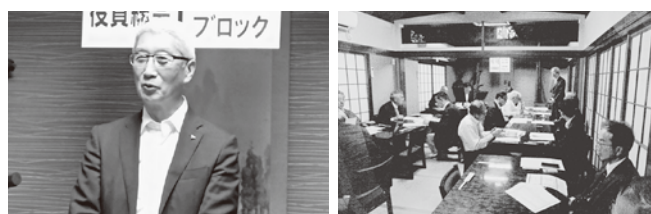
5/26 (月) 習志野ブロック