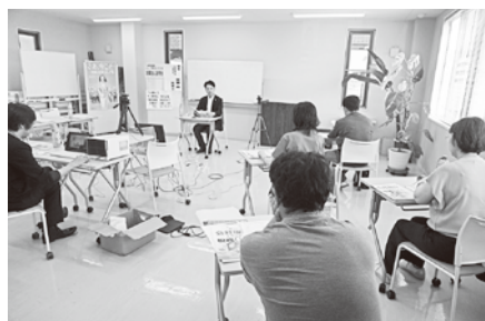
6/19 (木) 第2回決算法人説明会