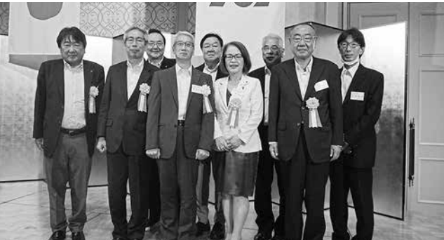
吉田会長、お祝いに駆けつけた副会長、委員長と記念撮影！