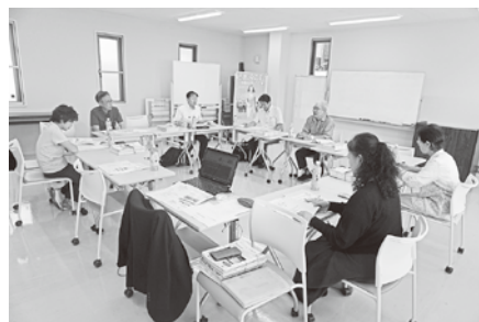
6/23 (月) 第2回広報委員会