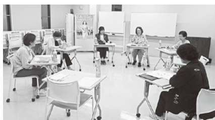
6/10 (火) 女性部会第2回役員会