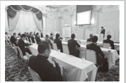
会員大会・税務等研修会 (写真は昨年の副署長講演 会、於/ホテルスプリ ングス幕張)