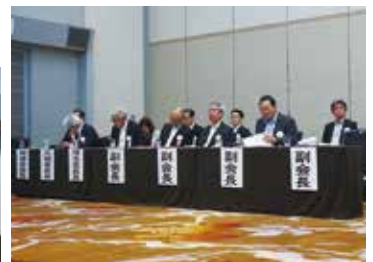
↑ 本会正副会長、委員長、部長、監事の執行部席