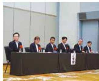
↑ 千葉西税務署、千葉県千葉西県税事務所からの来賓