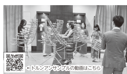
←トルンアンサンプルの動画はこちら