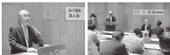
5/19 (月) 八千代ブロック