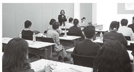
冒頭の三枝部会長挨拶