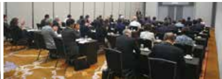
42名の新理事・新監事が出席。会議案を承認