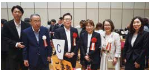
千葉西税務署長、同副署長、千葉西県税事務所長と