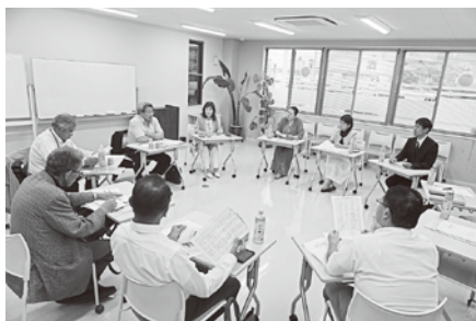
6/12 (木) 第1回研修委員会