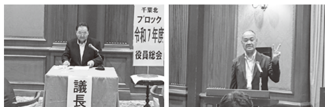
5/21 (水) 千葉北ブロック