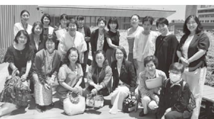
講座終了後、千葉市役所屋上にて記念撮影