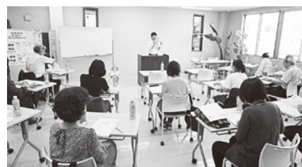
6/12 (木) 税法研究部会第1回研修会