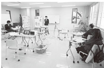
4/9 (水) 第1回新設法人説明会