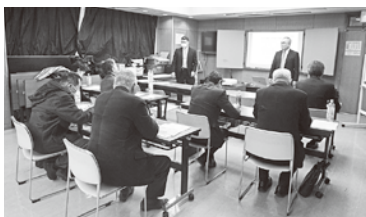
ブロック研修会 (写真は昨年12月開催「事業承継を4つの目で見ると」)