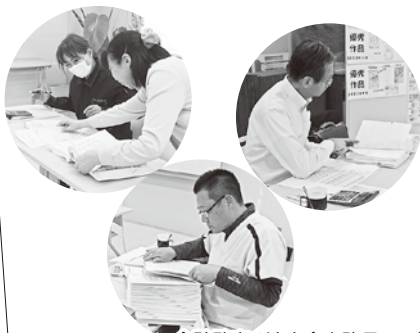
会計監査（法人会事務局にて）