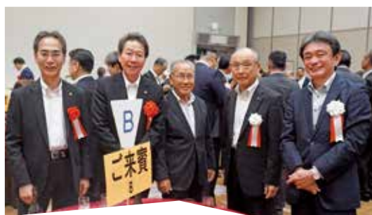
八千代市 服部市長と