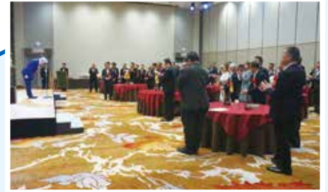
広い会場での立食交流会 多くの御参加ありがとうございます