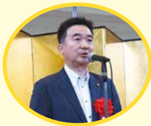
宮本 泰介 習志野市長