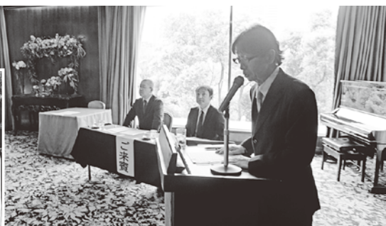
司会の久野総務委員(当時)と署からのご来賓、日保統括官、増田調査官