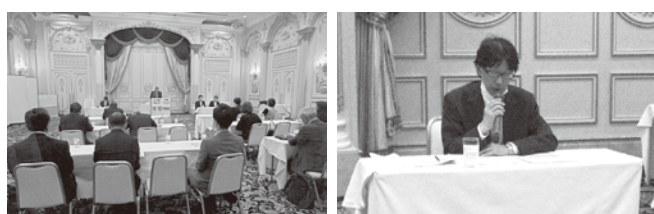
5/23 (金) 千葉西ブロック