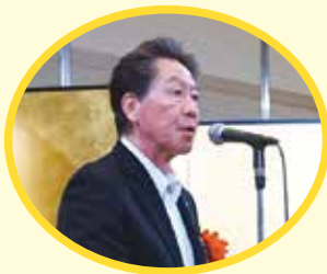
服部 友則 八千代市長