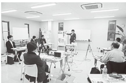
4/10 (木) 第1回決算法人説明会