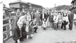
管外研修会(写真は最近3年間のもの)