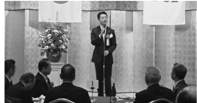
熊谷俊人千葉県知事からのお祝いご挨拶